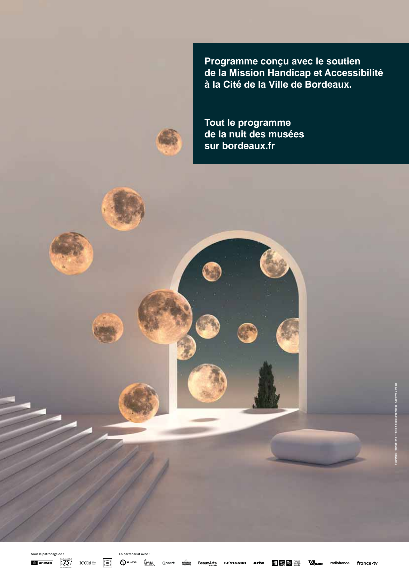
Illustration : Pasichlone — Déclinaisons graphiques : Cokume 3 Pieces

Tout le programme de la nuit des musées sur bordeaux.fr