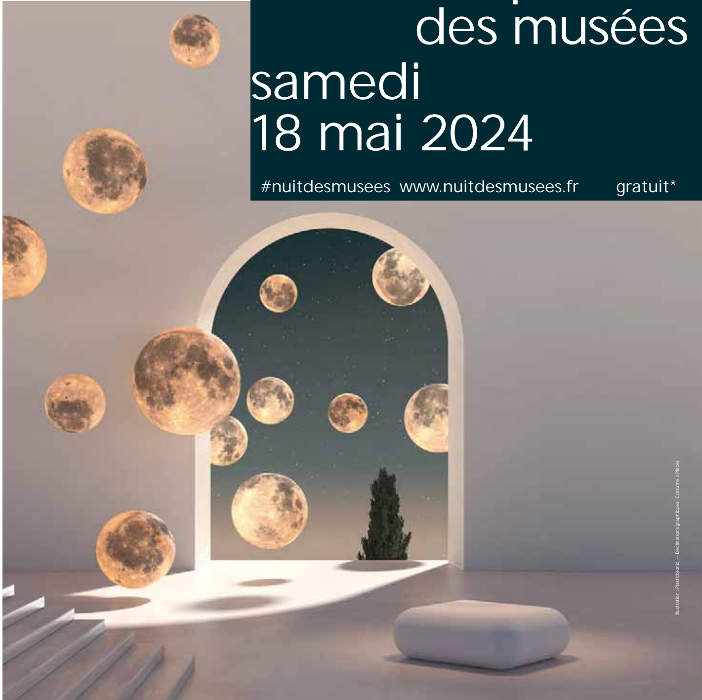
Illustration : Plastocubisme — Déclinaisons graphiques, Costume, 3 pièces